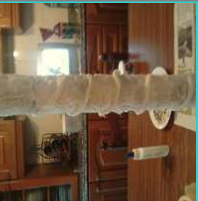
Cuando este bien seco le aplicamos una capa de pintura tempera blanca, para que asiente bien la pintura