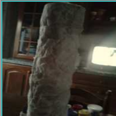
Así poco a poco hasta completar todo el tubo, asegurándonos que los papeles queden bien pegados, sobre todo los bordes.