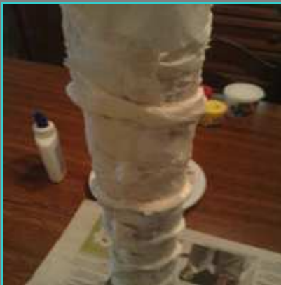
Podemos añadirle adornos en relieve como tiras o bolitas