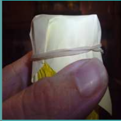
Colocamos la goma elástica