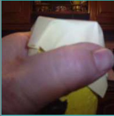
lo doblamos en una parte del tubo