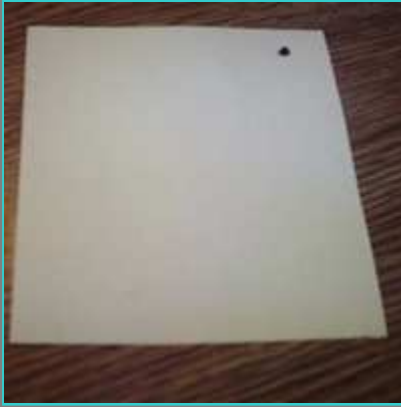
Cortamos dos trozos cuadrados de papel