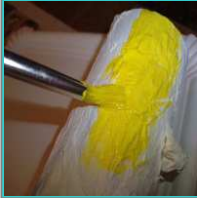
Al secarse la pintura blanca vamos pintando de colores.