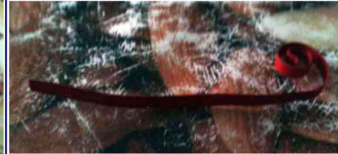
Con otro trozo de cartulila hacemos la trompa liando el borde en espiral