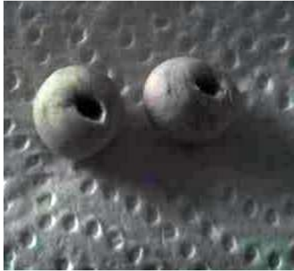
hacemos dos hondos en las bolas