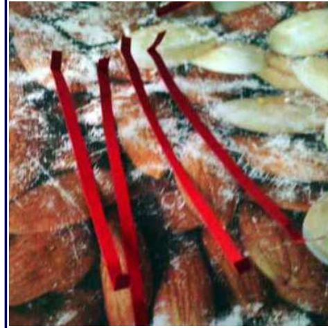
Cortamos 3 cartulunas rojas para las patas doblando los bordes