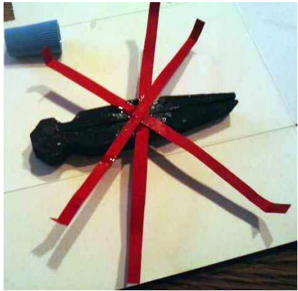
Cuando seque bien la pintura vamos pegando las partes, primero las patas por la parte de detrás