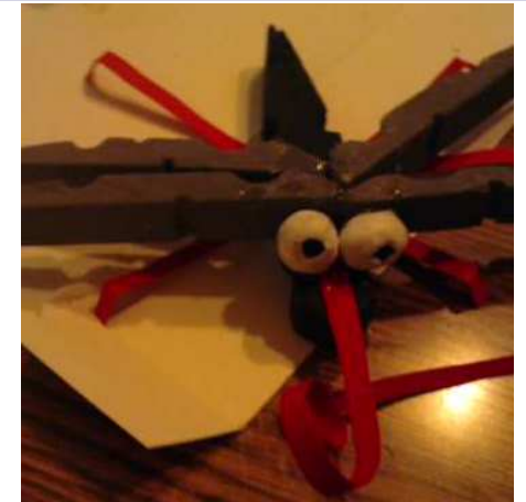
y los ojo