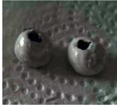
Pintamos las bolas de blanco y los hondos de negro